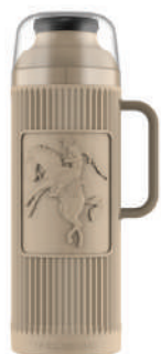
781 GFA TERM CHIMARRITA 1L BEGE CX/6 7891023509419