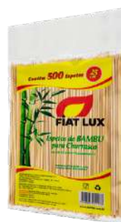
1947 ESPETO CHURRASCO BAMBU C/500 25CM CX/10 PCT/500 7896007901173