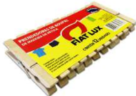
412 PREND ROUPAS MADEIRA MEDIO C/12 CX/50 7896007932726