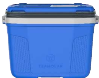
808 CAIXA TERM SUV 32L AZUL CX/1 7891023559056