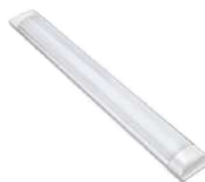
252 LUMINARIA LINE LED 120CM/36W 6500K CX/6 7897079075656