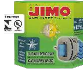
1161 ANTI-INSET ELETRIC APAR+PASTILHA CX/12 7896027011159