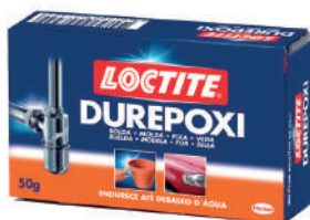
505 DUREPOXI 50G CX/4 DISPLAY C/12 7891200007929