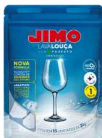
1365 LAVA-LOUCA HIDROSSOLUVEL C/15 CX/12 7896027075809