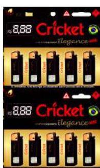
392 ISQUEIRO ELEGANCE MINI C/10 CX/20 7896280835035