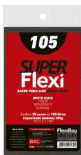
359 SUPER LIXO 105 LTS C/5 FD/20 7896492402377