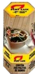
405 PALITO DENTE BAMBU C/200 CX/20 7896007972159