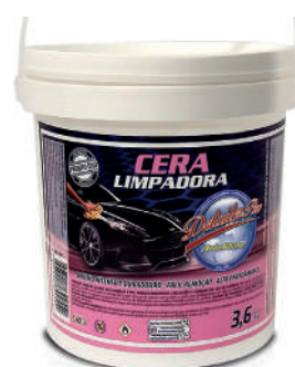
2110 CERA LIMP. LARANJA 3,6KG CX/4 7897217399552