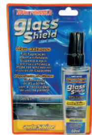
2120 GLASS SHIELD LIMPA VIDROS 60ML CX/12 7897217333372