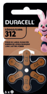
1189 PILHA DURACELL AUDITIVA 312 C/6 CX/50 0041333030203