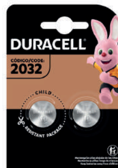
1598 BATERIA DURACELL LITIO CR2032 C/2 CX/72 (12X6) 0041333038216