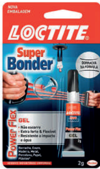
501 SUPER BONDER POWER FLEX 2G DISPLAY C/24 7891200012572