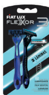
753 AP BARBEAR FLEXOR 3 AZUL C/2 CX/72 7896007990429