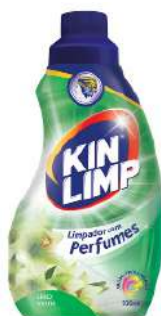
1410 KIN LIMP LIMPADOR PERF LIRIO VERDE 500ML CX/12 7896050506196