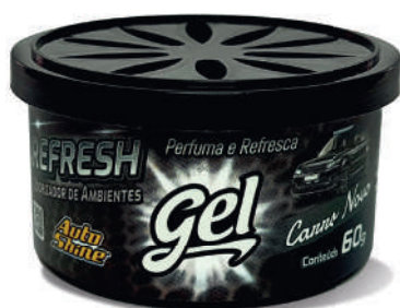
2148 REFRESH GEL CARRO NOVO 60GR CX/24 7897217307076