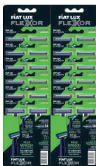
493 AP BARBEAR FLEXOR 2 CABO LONGO AZUL C/24 CX/24 7896007990122