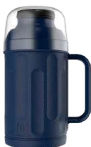
797 GFA TERM PERSONAL 500ML AZUL CX/6 7891023542447