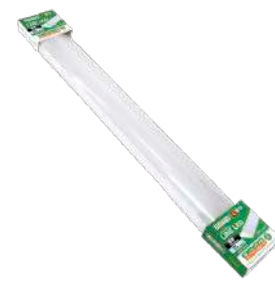
251 LUMINARIA LINE LED 60CM/18W 6500K CX/6 7897079075649