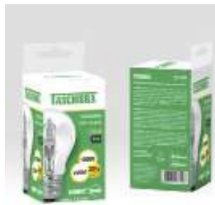
774 LAMP HALOGENA A55 /42W 127V 2700K CX/100 7897079064704