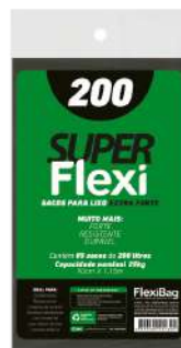
361 SUPER LIXO 200 LTS C/5 FD/20 7896492402391