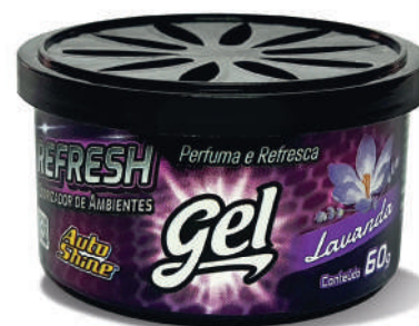
2130 REFRESH GEL LAVANDA 60GR CX/24 7897217306925