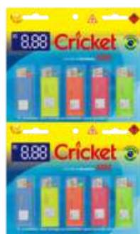
1110 ISQUEIRO FLUOR MINI C/10 CX/20 7896280835196