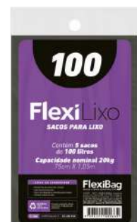
236 FLEXI LIXO PRETO 100 LTS ALMOFO C/5 FD/50 7896492401332