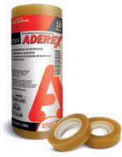
635 FITA ADESIVA ADEREX 12MM X 30M C/10 M.10 CX/400 635