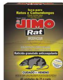
848 JIMO RAT C/40 CX/4 7896027027013