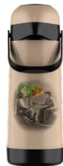
1174 GFA TERM MAGIC PUMP 1,8L GAUDERIO CX/6 7891023547350