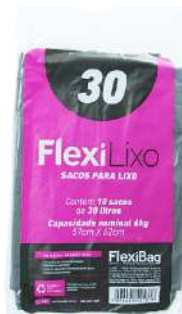
238 FLEXI LIXO PRETO 30 LTS ALMOFO C/10 FD/50 7896492401318