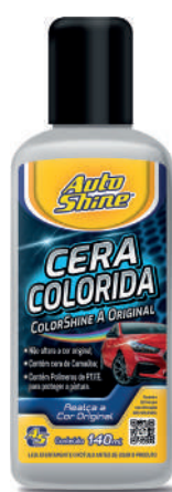
2106 CERA COLOR. PRATA 140ML CX/12 7897217303115