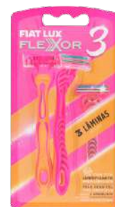
754 AP BARBEAR FLEXOR 3 ROSA C/2 CX/72 7896007990627