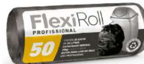
231 FLEXI ROLL PRETO 50 LTS C/30 FD/10 7896492410150