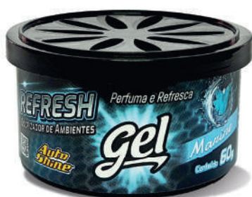
2131 REFRESH GEL MARINE 60GR CX/24 7897217306932