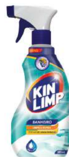
1405 KIN LIMP BANHEIRO 500ML CX/12 7896050506011