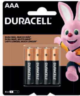
217 PILHA DURACELL PALITO AAA C/4 CX/48 (4X12) 0041333001098