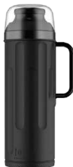
794 GFA TERM PERSONAL 1L PRETA CX/6 7891023545172