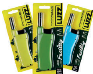
2039 ACENDEDOR CURTO AMARELO FACILITY CX/12 7898608573308