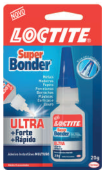
631 SUPER BONDER ULTRA 20G DP/8 7891200015153