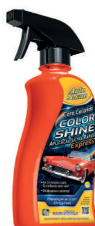
2114 CERA LIQ. C. EXPRESS VRM 500ML CX/12 7897217331361