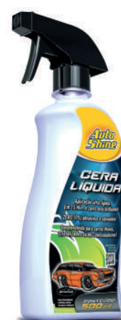
2111 CERA LIQUIDA AUTOSHINE 500ML CX/12 7897217309018