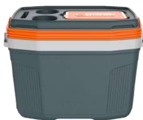
1195 CAIXA TERM SUV 20L CINZA CX/1 7891023568058