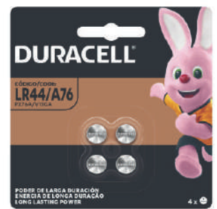
1186 BATERIA DURACELL LR44 C/4 CX/36 0041333034294