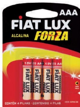
1529 PILHA ALCALINA PALITO AAA C/4 CX/48 7896007904471