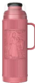
1173 GFA TERM CHIMARRITA 1L ROSA CX/6 7891023567525