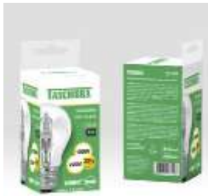
14 LAMP HALOGENA A55 /70W 127V 2700K CX/100 7897079064711