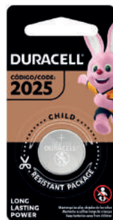
388 BATERIA DURACELL LITIO CR2025 CX/72 (12X6) 0041333030104