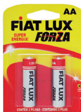
647 PILHA COMUM PEQUENA AA C/2 CX/96 7896007974177