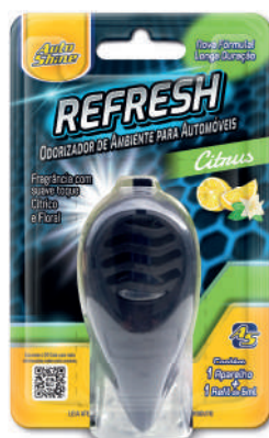
2134 REFRESH LIQ. CITRUS 6ML CX/12 7897217307038