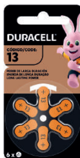
1188 PILHA DURACELL AUDITIVA 13 C/6 CX/50 0041333030197