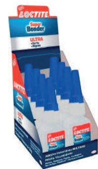
632 SUPER BONDER ULTRA 20G CARTELA CX/8 7891200015573