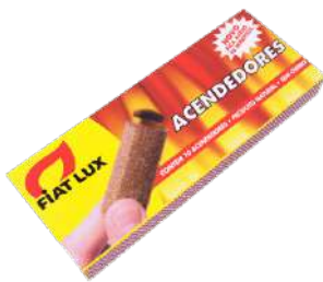
401 ACENDEDOR FIAT LUX BASTAO C/10 CX/3 FD/10 7896007932931