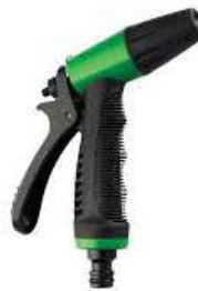
48 HIDROPISTOLA LORENZETTI CX/4 7896451852786