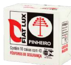
396 FOSFOROS PINHEIRO 40 PALITOS CX/6 FD/20 78960074912124