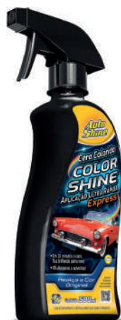
2113 CERA LIQ. C. EXPRESS PRETA 500ML CX/12 7897217331354