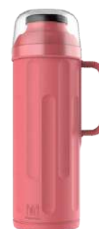
1785 GFA TERM PERSONAL 1L ROSA CX/6 7891023571904