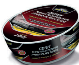
2115 CERA P PLASTICOS AUTOSHINE 100G CX/12 7897217332016