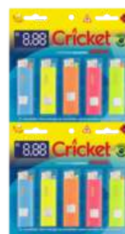
1532 ISQUEIRO FLUOR ORIGINAL C/10 CX/20 1532