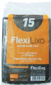
232 FLEXI LIXO PRETO 15 LTS ALMOFO C/20 FD/50 7896492401301