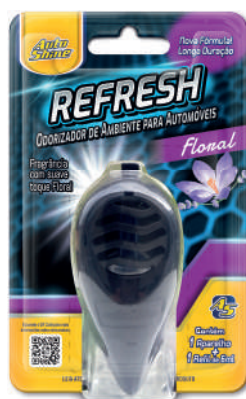
2135 REFRESH LIQ. FLORAL 6ML CX/12 7897217307052