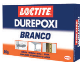
507 DUREPOXI BRANCO 50G CX/4 DISPLAY C/12 7891200014439