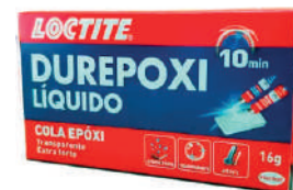
512 DUREPOXI LIQUIDO 16G CX/4 DISPLAY C/6 7891200014361