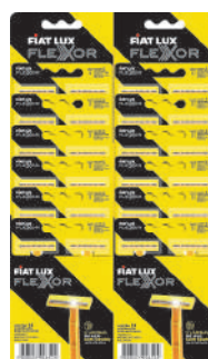
492 AP BARBEAR FLEXOR AMARELO 12X2 CX/24 7896007990528