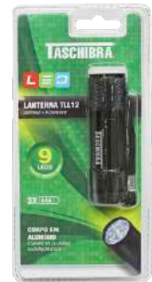
250 LANTERNA LED TLL 12 CX/20 7897079054910