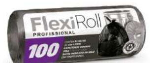
228 FLEXI ROLL PRETO 100 LTS C/15 FD/10 7896492409659