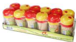
407 PALITO DENTE BAMBU C/240 CX/20 7896007972104