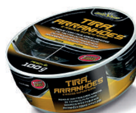
2116 CERA TIRA RISCOS AUTOSHINE 100G CX/12 7897217333303