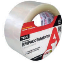
643 FITA EMPACOTAMENTO 48MM X 100M C/5 M.5 CX/40 7896193252356