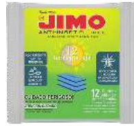
837 ANTI-INSET REFIL PASTILHA C/20 CX/5 7896027010251