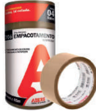
105 FITA EMPACOTAMENTO 45MM X 45M C/4 MARROM M.4 CX/144 7898608572929