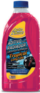
2103 ADITIVO RADIADOR CONC. ROSA 1L CX/12 7897217307977