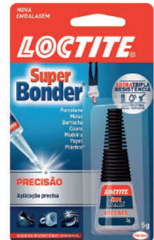
502 SUPER BONDER PRECISAO 5G DISPLAY C/24 789120023457