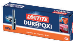
506 DUREPOXI 100G CX/4 DISPLAY C/12 7891200007899