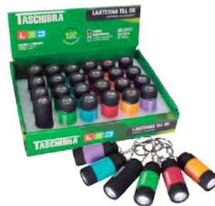
776 LANTERNA LED TLL 08 C/24 DISPLAY C/24 7897079054873