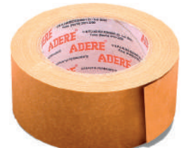
461 FITA KRAFT CREPADO 45MM X 50M C/5 M.5 CX/30 461