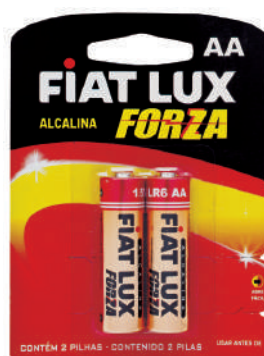
1530 PILHA ALCALINA PEQUENA AA C/2 CX/96 7896007904174