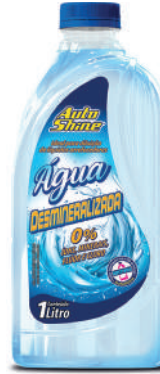
2104 AGUA DESMINERALIZADA 1L CX/12 7897217332566