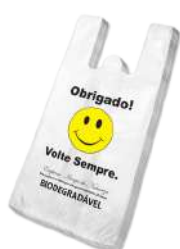
1566 SACOLA VOLTE SEMPRE 40X50 C/500 FD/500 1566