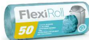
358 FLEXI ROLL AZUL 50 LTS C/40 FD/10 7896492400335