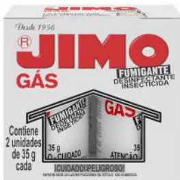
843 GAS FUMIGANTE ESTOJO 2X35G CX/18 7896027080001