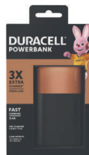
1118 CARREGADOR POWER BANK 10050 MAH 3X CX/4 0041333033990