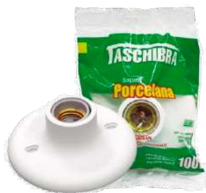
241 PAFLON E-27 100W PORCELANA BRANCO CX/20 7897079052732