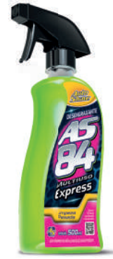
2119 DESENGRAXANTE AS84 500ML CX/12 7897217334164