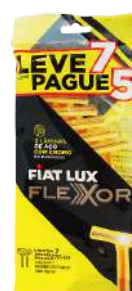
1388 AP BARBEAR FLEXOR AMARELO L7P5 CX/10 PCT/8 7896007994526