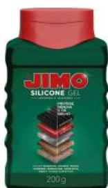
851 SILICONE GEL LAVANDA 200G CX/12 7896027052718