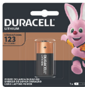
1060 BATERIA DURACELL LITIO CR123 3V CX/36 0041333030074