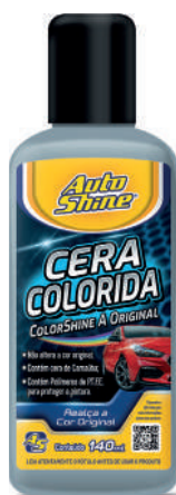
2105 CERA COLOR. CINZA 140ML CX/12 7897217303108