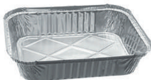
2029 BANDEJA ALUMINIO 1500ML C/100 CX/100 2029