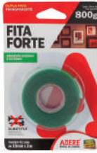
111 FITA DUPLA FACE ACRILICA 19MM X 2M TRANSP CX/24 7896193236783