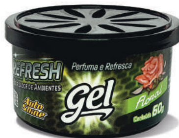
2129 REFRESH GEL FLORAL 60GR CX/24 7897217333327