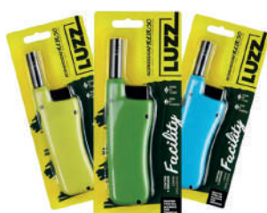
2036 ACENDEDOR CURTO AZUL FACILITY CX/12 7898608572186