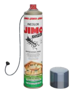
889 JIMO CUPIM AERO 400ML CX/12 7896027040012