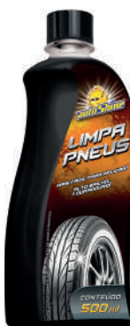
2146 LIMPA PNEU 500ML AUTOSHINE CX/24 7897217300701