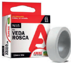
94 FITA VEDA ROSCA 12MM X 10M CX/100 7896193295049