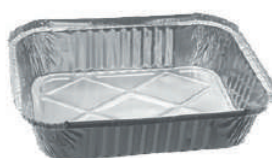
2022 ABANDEJA ALUMINIO 225ML C/10 CX/100 7898608573889