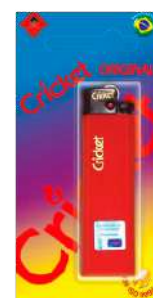
393 ISQUEIRO ORIGINAL MISTO SM CX/200 7896280840015