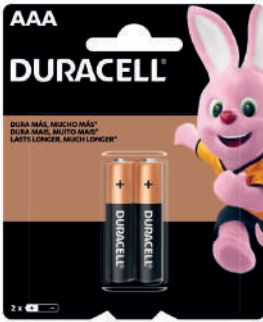
216 PILHA DURACELL PALITO AAA C/2 CX/48 (4X12) 0041333001074