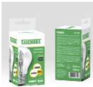
742 LAMP HALOGENA A55 /100W 220V 2700K CX/100 7897079066128