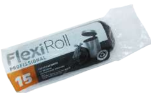
229 FLEXI ROLL PRETO 15 LTS C/60 FD/10 7896492410143