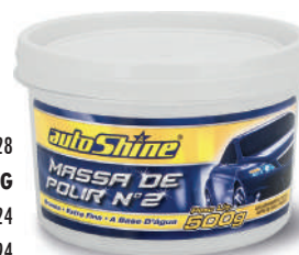
2128 MASSA DE POLIR N2 AUTOSHINE 500G CX/24 7897217302194