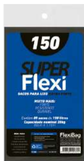
360 SUPER LIXO 150 LTS C/5 FD/20 7896492402384