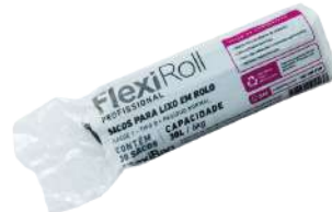
230 FLEXI ROLL PRETO 30 LTS C/30 FD/10 7896492410136