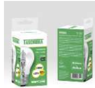
15 LAMP HALOGENA A55 /100W 127V 2700K CX/100 7897079066111