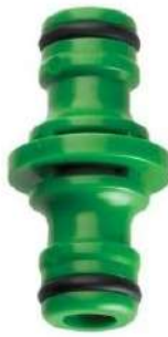
43 CONECTOR ENGATE RAPIDO CX/10 7896451852670