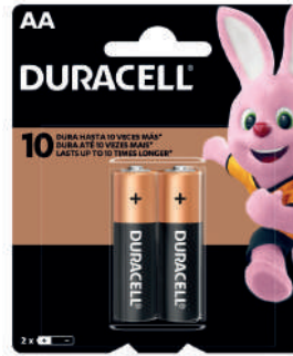
211 PILHA DURACELL PEQUENA AA C/2 CX/48 (4X12) 0041333001005