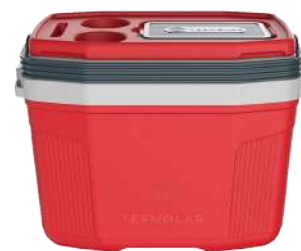
1768 CAIXA TERM SUV 20L VERMELHA CX/1 7891023571959