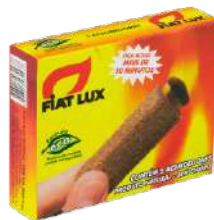
400 ACENDEDOR FIAT LUX BASTAO C/5 CX/60 7896007930937