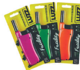
2038 ACENDEDOR CURTO ROSA FACILITY CX/12 7898608573278