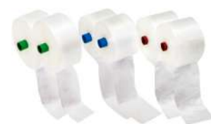
282 SPEED ROLL 33CM X 45CM C/375 CX/6 282