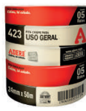
100 FITA CREPE ADERE 24MM X 50M C/5 M.5 CX/60 7896193243880