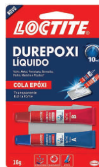
508 DUREPOXI LIQUIDO 16G BLISTER CX/12 7891200011537