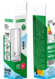
12 LAMP FLUORESC TKT 20 3U/20W 127V 6400K CX/10 7897079052695