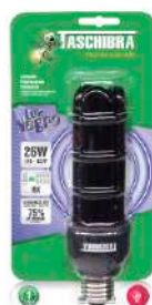
258 LAMP FLUORESC TKT LUZ NEGRA 3U/26W 127V CX/10 7897079026160