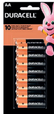
215 PILHA DURACELL PEQUENA AA C/16 CX/6 0041333666815