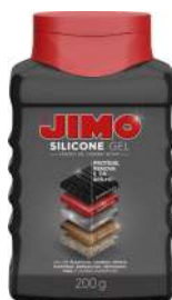
850 SILICONE GEL CARRO NOVO 200G CX/12 7896027052725