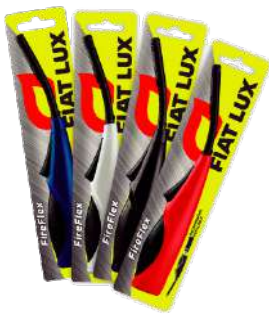
404 ACENDEDOR FOGAO FIREFLEX CX/16 8710732230461