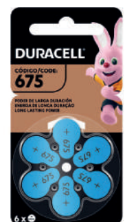
1190 PILHA DURACELL AUDITIVA 675 C/6 CX/50 0041333030210