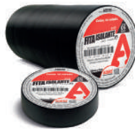
96 FITA ISOLANTE 19MM X 5M C/6 M.6 CX/114 7896193321953