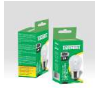
13 LAMP INCAND FOGAO/GELAD E-27/40W 127V CX/50 7897079017236