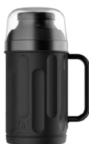
798 GFA TERM PERSONAL 500ML PRETA CX/6 7891023554211