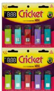
395 ISQUEIRO AQUARELA MINI C/10 CX/20 7896280835004