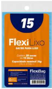
233 FLEXI LIXO AZUL 15 LTS ALMOFO C/20 FD/50 7896492400212