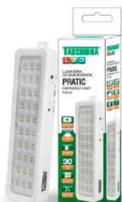
257 LUMINARIA EMERGENCIA PRATIK LED /2W 6500K CX/6 7897079076615