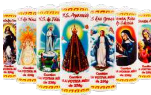
655 VELA FIAT LUX 7 DIAS SANTOS 250G CX/12 7896007921225