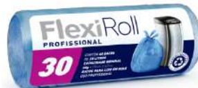
357 FLEXI ROLL AZUL 30 LTS C/40 FD/10 7896492400328