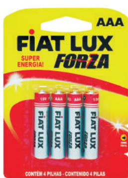
651 PILHA COMUM PALITO AAA C/4 CX/48 7896007974474