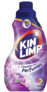
1409 KIN LIMP LIMPADOR PERF LAVANDA 500ML CX/12 7896050506172