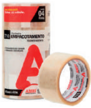
1126 FITA EMPACOTAMENTO 45MM X 40M C/4 TRANSP M.4 CX/144 7896193241688