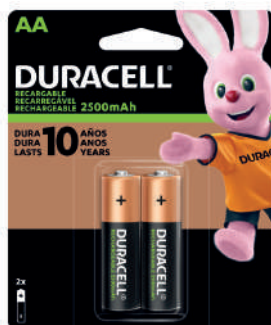
385 PILHA PEQUENA AA C/2 RECARREGAVEL CX/24 0041333668178