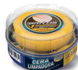
2109 CERA LIMP. C APLICADOR 200GR CX/24 7897217395028