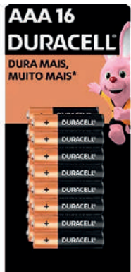
220 PILHA DURACELL PALITO AAA C/16 CX/6 0041333666952