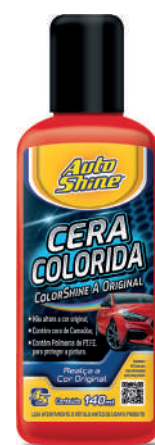
2108 CERA COLOR. VERMELHO 140ML CX/12 7897217303092