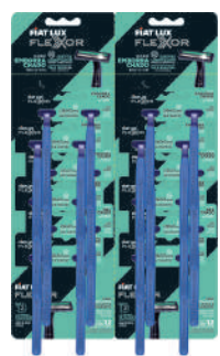
619 AP BARBEAR FLEXOR 2 CABO EMBOR AZUL C/24 CX/22 7896007998326