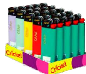
442 ISQUEIRO CLASSIC ORIGINAL C/25 CX/8 7896280835226