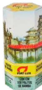
615 PALITO DENTE BAMBU C/100 CX/20 7896007972142