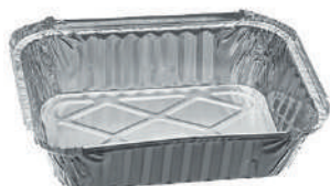
2040 BANDEJA ALUMINIO 500ML C/10 CX/50 7898608573896