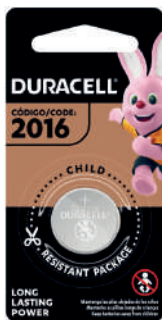
387 BATERIA DURACELL LITIO CR2016 CX/36 0041333030098