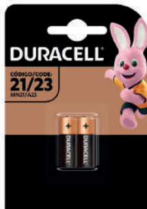
1850 BATERIA DURACELL ALCALINA 12V C/2 CX/36 (6X6) 0041333038896