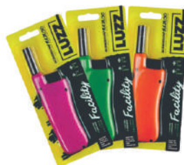
2037 ACENDEDOR CURTO LARANJA FACILITY CX/12 7898608573247