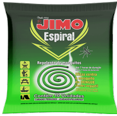
842 JIMO ESPIRAL C/10 CX/12 7896027080025