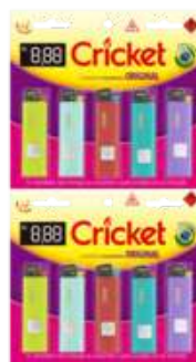
394 ISQUEIRO CLASSIC ORIGINAL C/10 CX/20 7896280833116