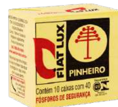
1688 FOSFOROS PINHEIRO 40 PALITOS CARTONADO CX/6 FD/20 7896007912223