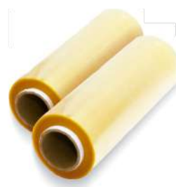
422 RESINITE FLEXIBAG 38CM X 1000M CX/1 422