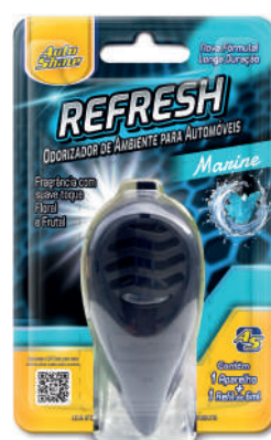
2136 REFRESH LIQ. MARINE 6ML CX/12 7897217307045