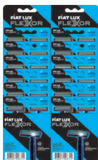
618 AP BARBEAR FLEXOR 2 AZUL C/24 CX/24 7896007998722