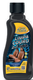
2125 LIMPA COURO AUTOSHINE 200GR CX/12 7897217307168