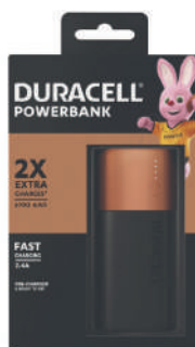
1117 CARREGADOR POWER BANK 6700 MAH 2X CX/4 0041333033983