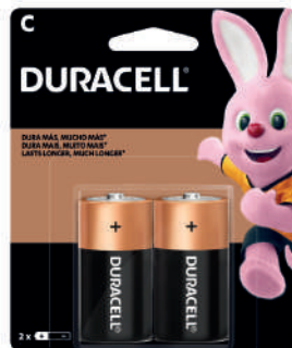
221 PILHA DURACELL MEDIA C C/2 CX/48 (6X8) 0041333000992