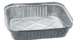
2026 BANDEJA ALUMINIO 225ML C/200 CX/200 2026