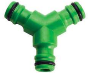
199 DERIVACAO Y CX/10 7896451852724