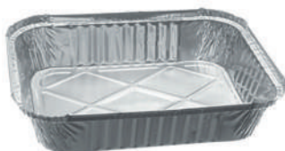
2025 BANDEJA ALUMINIO 1500ML C/10 CX/50 7898608573926