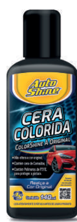
2107 CERA COLOR. PRETO 140ML CX/12 7897217303092