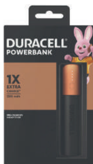
1116 CARREGADOR POWER BANK 3350 MAH 1X CX/4 0041333033976