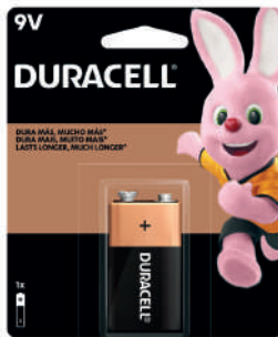
226 BATERIA DURACELL ALCALINA 9V CX/48 (4X12) 0041333001043