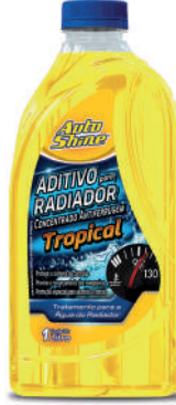
2145 ADITIVO RADIADOR CONC. AMRL 1L CX/12 7897217333983