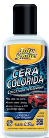
2143 CERA COLOR. BRANCO 140ML CX/12 7897217303009