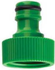
45 ADAPTADOR 3/4 TORNEIRA CX/8 7896451852748