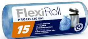
356 FLEXI ROLL AZUL 15 LTS C/80 FD/10 7896492400311