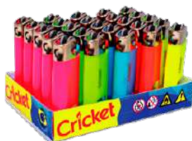
443 ISQUEIRO AQUARELA MINI C/25 CX/8 7896280835271