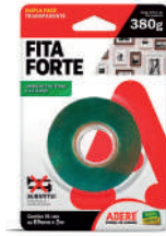
451 FITA DUPLA FACE ACRILICA 9MM X 2M TRANSP CX/36 7896193236752