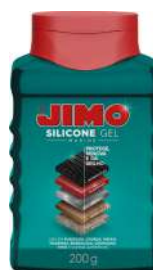
852 SILICONE GEL MARINE 200G CX/12 7896027052763