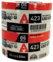
99 FITA CREPE ADERE 18MM X 50M C/6 M.6 CX/72 7896193330016