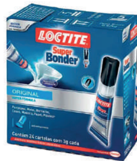
2042 SUPER BONDER ORIGINAL 3G 24+2 CX/24 + 2 5789120019094