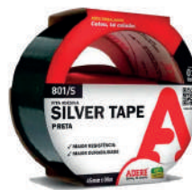
381 FITA SILVER TAPE 45MM X 5M PRETA CX/36 7896193270978