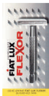
757 AP BARBEAR FLEXOR METAL CX/36 7896007990412