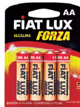
1531 PILHA ALCALINA PEQUENA AA C/4 CX/48 7896007904273