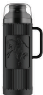
782 GFA TERM CHIMARRITA 1L PRETA CX/6 7891023544434