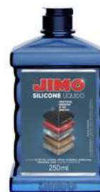
854 SILICONE LIQUIDO 250ML CX/12 7896027052503