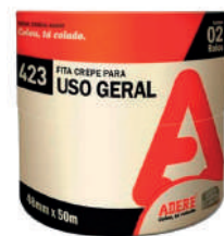
102 FITA CREPE ADERE 48MM X 50M C/2 M.2 CX/36 7896193321816