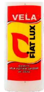
654 VELA FIAT LUX 7 DIAS GROSSA 325G CX/12 7896007921515