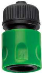
200 ENGATE RAPIDO C/ STOP CX/6 7896451852762