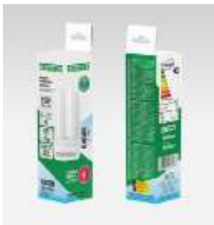
7 LAMP FLUORESC TKT 15 3U/15W 127V 6400K CX/10 7897079017977