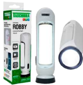
1763 LANTERNA LED ROBBY TLE 07 CX/6 7897079089882