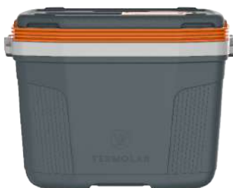
812 CAIXA TERM SUV 32L CINZA CX/1 7891023562834