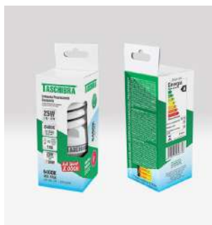
11 LAMP FLUORESC TKFS 25 T2/25W 127V 6400K CX/10 7897079048346