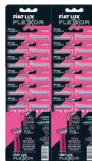
620 AP BARBEAR FLEXOR 2 CABO LONGO ROSA C/24 CX/24 7896007998277