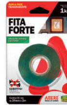
1125 FITA DUPLA FACE ACRILICA 24MM X 2M TRANSP CX/24 7896193241299