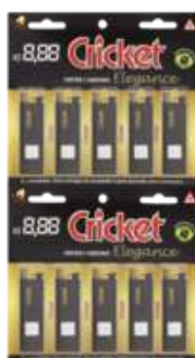
391 ISQUEIRO ELEGANCE ORIGINAL C/10 CX/20 7896280833031