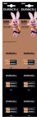
219 PILHA PALITO AAA 6X2 CARTELAO CX/10 0041333431482