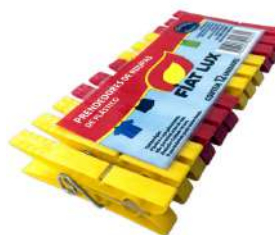
413 PREND ROUPAS PLASTICO C/12 CX/50 7896007942824