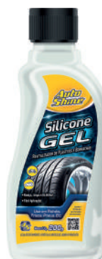
2138 SILICONE GEL AUTOSHINE 200GR CX/24 7897217399583