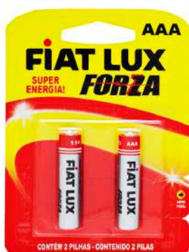
650 PILHA COMUM PALITO AAA C/2 CX/96 7896007974375