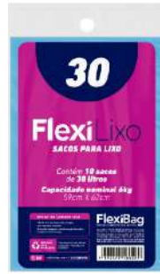
234 FLEXI LIXO AZUL 30 LTS ALMOFO C/10 FD/50 7896492400229