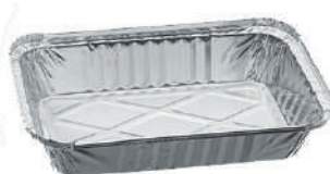
2027 ABANDEJA ALUMINIO 750ML C/100 CX/100 2027