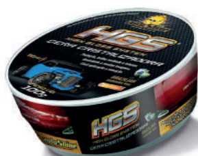
2144 CERA CRISTALIZADORA 100GR CX/12 78972173031101