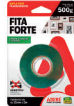
110 FITA DUPLA FACE ACRILICA 12MM X 2M TRANSP CX/36 7896193236769