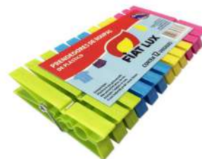
617 PREND ROUPAS PLASTICO GRANDE C/12 CX/50 7896007932825