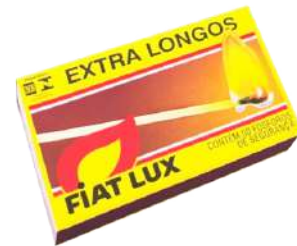
399 FOSFOROS EXTRA LONGO 50 PALITOS CX/6 FD/24 7896280835004