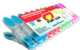
440 PREND ROUPAS PLASTICO EMBORRACHADO C/12 CX/50 7896007932221