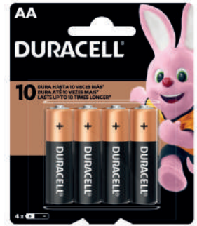
212 PILHA DURACELL PEQUENA AA C/4 CX/48 (4X12) 0041333001029