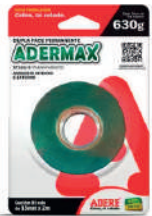
450 FITA DUPLA FACE ACRILICA 15MM X 2M TRANSP CX/24 7896193236776