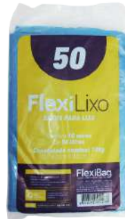
235 FLEXI LIXO AZUL 50 LTS ALMOFO C/10 FD/50 7896492400236