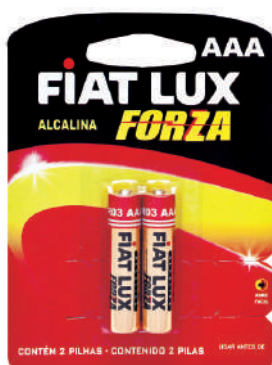
1528 PILHA ALCALINA PALITO AAA C/2 CX/96 7896007904372