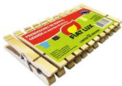
439 PREND ROUPAS MADEIRA GRANDE C/12 CX/50 7896007932122