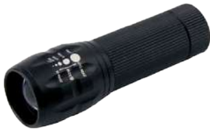
249 LANTERNA LED TLL 04 CX/10 7897079041217