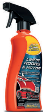
2147 LIMPA RODAS E MOTOR 500ML CX/12 7897217309025