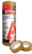
131 FITA ADESIVA ADEREX 12MM X 10M C/10 M.10 CX/300 7896193262423