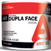
82 FITA DUPLA FACE 12MM X 30M M.8 CX/64 17896193330983