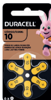
1187 PILHA DURACELL AUDITIVA 10 C/6 CX/50 0041333030180