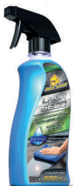
2122 LAVA A SECO AUTOSHINE 500ML CX/12 7897217331729