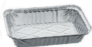
2023 BANDEJA ALUMINIO 750ML C/10 CX/50 7898608573902