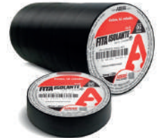
380 FITA ISOLANTE 19MM X 20M C/6 M.6 CX/54 380