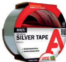
103 FITA SILVER TAPE 45MM X 5M PRATA CX/24 7896193219366