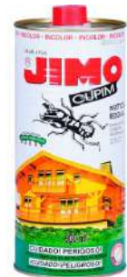
891 JIMO CUPIM INCOLOR 900ML CX/12 7896027042429