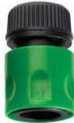
46 ENGATE RAPIDO CX/6 7896451852755