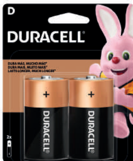
222 PILHA DURACELL GRANDE D C/2 CX/48 (8X6) 0041333000985