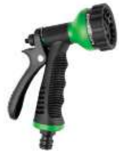
261 HIDROPISTOLA MULTIFUNCAO CX/4 7896451852793