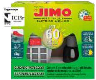
1160 ANTI-INSET ELETRIC APAR+REFIL LIQUIDO CX/8 7896027011227