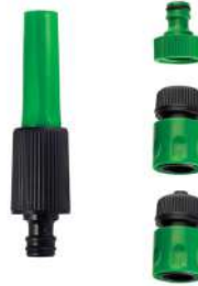
201 CONJUNTO ESGUICHO MULTIFUNCAO CX/4 7896451852823