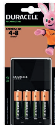
2011 CARREGADOR DE PILHAS + 4 PILHAS AA 2500MAH CX/4 0041333031217