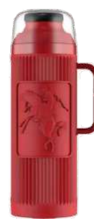
784 GFA TERM CHIMARRITA 1L VERMELHA CX/6 7891023558059