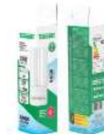
8 LAMP FLUORESC TKT 25 3U/25W 127V 6400K CX/10 7897079032048