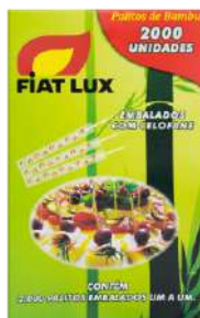
407 PALITO DENTE BAMBU C/2000 CELOFANE CX/10 7896007973194