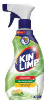
1406 KIN LIMP COZINHA 500ML CX/12 7896050506059