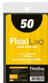
239 FLEXI LIXO PRETO 50 LTS ALMOFO C/10 FD/50 7896492401325