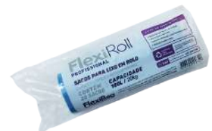
355 FLEXI ROLL AZUL 100 LTS C/20 FD/10 7896492400342