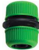
44 UNIAO REPARADORA CX/8 7896451852687