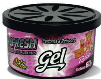
2132 REFRESH GEL TALCO 60GR CX/24 7897217306901