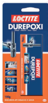
511 DUREPOXI 100G BLISTER CX/24 7891200008971