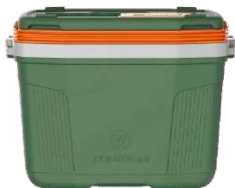
1178 CAIXA TERM SUV 32L VERDE CX/1 7891023565040