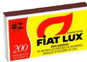
1994 FOSFOROS COZINHA FORTE 200 PALITOS CX/9 FD/16 7896007942534