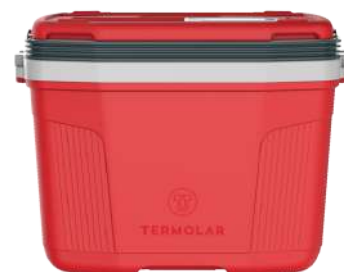
809 CAIXA TERM SUV 32L VERMELHA CX/1 7891023559063