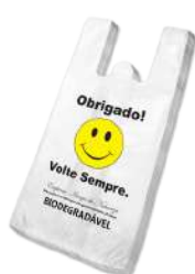
425 SACOLA VOLTE SEMPRE 40X50 C/1000 FD/1000 425