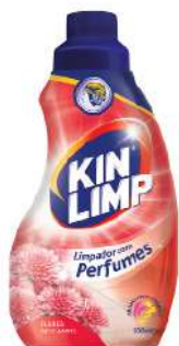
1408 KIN LIMP LIMPADOR PERF FLORES CAMPO 500ML CX/12 7896050506189