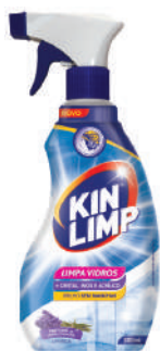
1407 KIN LIMP LIMPA VIDROS 500ML CX/12 7896050506097