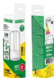
880 LAMP FLUORESC TKT 15 3U/15W 127V 2700K CX/10 7897079061482