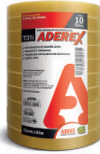
76 FITA ADESIVA ADEREX 12MM X 40M C/10 M.10 CX/180 7896193262454