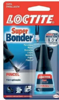
514 SUPER BONDER PINCEL 4G CX/24 7891200006366