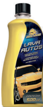
2123 LAVA AUTOS AUTOSHINE 500ML CX/24 7897217300695