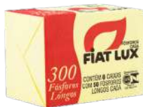
397 FOSFOROS CASA 50 PALITOS CX/6 FD/20 7896007942213