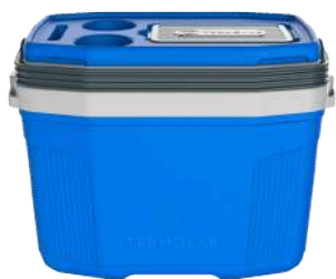
1194 CAIXA TERM SUV 20L AZUL CX/1 7891023568041