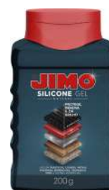
853 SILICONE GEL NATURAL 200G CX/12 7896027052701