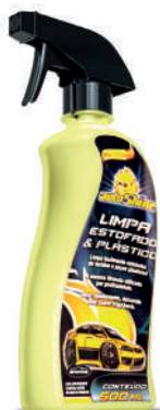
2126 LIMPA ESTOFADO AUTOSHINE 500ML CX/12 7897217309032