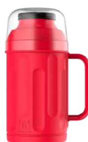
800 GFA TERM PERSONAL 500ML VERMELHA CX/6 7891023070223