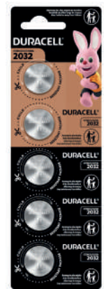
1599 BATERIA DURACELL LITIO CR2032 C/5 CX/200 (10X20) 0041333038865