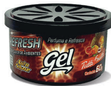
2133 REFRESH GEL TUTTI FRUTTI 60GR CX/24 7897217306918