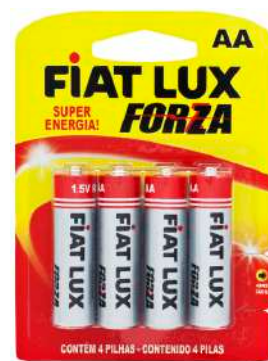
648 PILHA COMUM PEQUENA AA C/4 CX/48 7896007974276