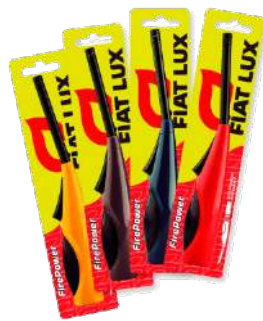
403 ACENDEDOR FOGAO FIREPOWER CX/18 7896280835097