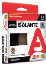
117 FITA ISOLANTE 19MM X 20M PROFISS CX/60 7896193332041