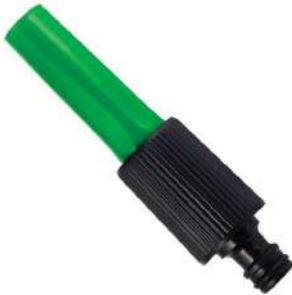
47 ESGUICHO AJUSTAVEL CX/5 7896451852779