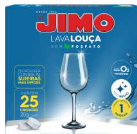
885 LAVALOUCA PASTILHA C/25 CX/12 7896027075502