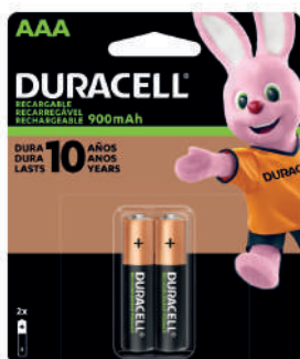
386 PILHA PALITO AAA C/2 RECARREGAVEL CX/24 0041333667157