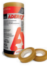
634 FITA ADESIVA ADEREX 12MM X 20M C/10 M.10 CX/250 634