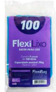
232 FLEXI LIXO AZUL 100 LTS ALMOFO C/5 FD/50 7896492400243