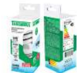
10 LAMP FLUORESC TKFS 15 T2/15W 127V 6400K CX/10 7897079048261