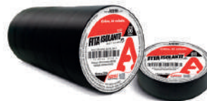
457 FITA ISOLANTE 19MM X 10M C/6 M.6 CX/72 457