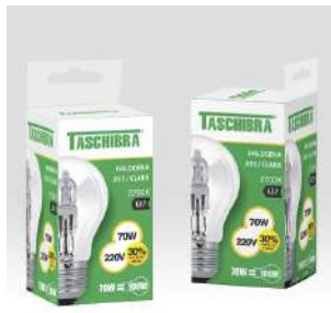
743 LAMP HALOGENA A55 /70W 220V 2700K CX/100 7897079064742