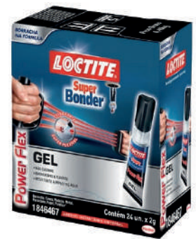
2043 SUPER BONDER POWER FLEX 2G 24+2 CX/24 + 2 27891200012576