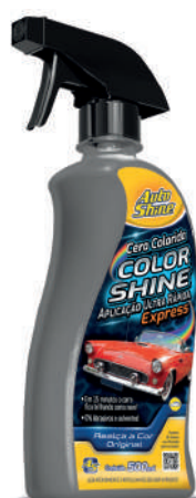
2112 CERA LIQ. C. EXPRESS PRATA 500ML CX/12 7897217331347