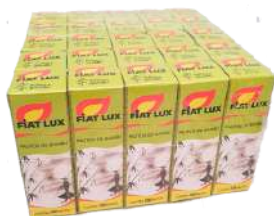
2156 PALITO DENTE BAMBU C/100 NOVO CX/500 7896007972111