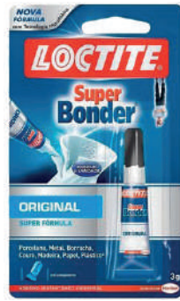
499 SUPER BONDER ORIGINAL 3G DISPLAY C/24 7891200190942