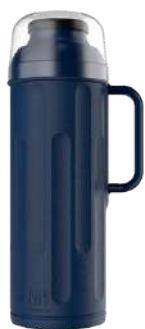
793 GFA TERM PERSONAL 1L AZUL CX/6 7891023547794